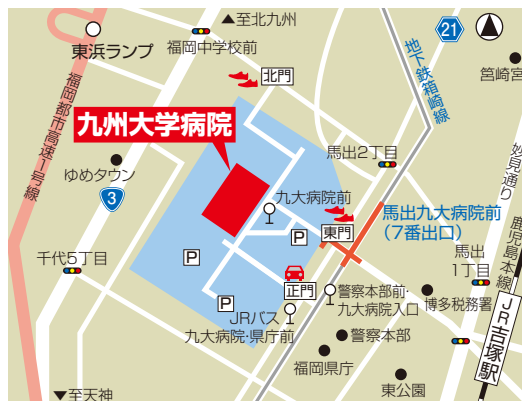
外来診療棟にお越しの際は、東門からのアプローチが便利です。お車の方は、正門からのみの入構です